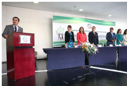
Instalación de la Comisión de la Familia en el Senado

El desplegado publicado por los abortistas contra natura, afirma que si se impone la agenda planteada en la instalación de la Comisión, se estaría discriminado al 18 por ciento de las familias nucleares que están compuestas por hogares monoparentales; 229 mil 473 familias integradas por parejas del mismo sexo, de las cuales más de 172 mil están conformadas por parejas homosexuales que tienen hijos.