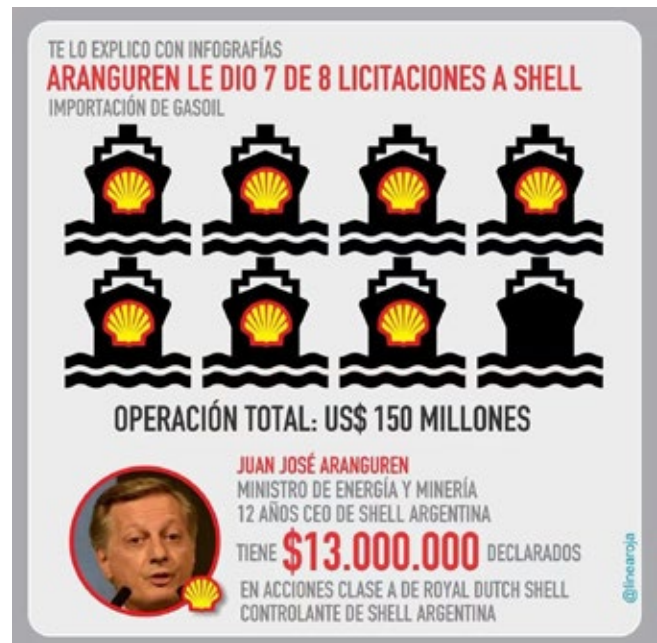
INFOGRAFÍA: SHELL VS ARGENTINA

Aranguren añadió que el aumento de los costos se debe al fuerte incremento en pesos argentinos que se está produciendo en el costo del petróleo crudo. Mientras tanto, en enero el Gobierno acusó a Aranguren de presuntas operaciones especulativas para forzar la caída de la propia moneda argentina.