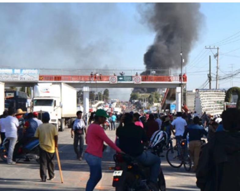
REVUELTAS SOCIALES EN MÉXICO

En medio de la vorágine de reformas que ha desatado el actual gobierno de México con el fin de llevar a plenitud las exigencias del Tratado de Libre Comercio que ha provocado miles de quiebras y el decrecimiento de la economía nacional durante estos veinte años, llama la atención la agresividad de las medidas que el gobierno intenta imponer sobre la población a fin de cumplir con los compromisos adquiridos con los centros de poder económico mundial.