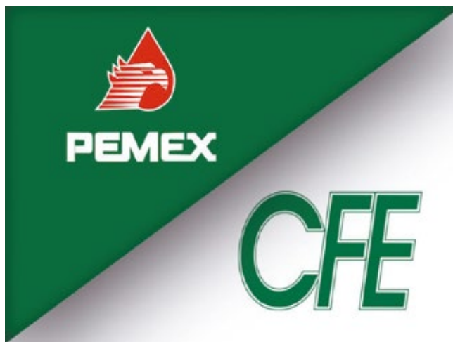
PEMEX Y CFE RECURSO: EL DICTAMEN

La reforma fiscal provocará miles de cierres de pequeñas y micro empresas con lo que se beneficiará enormemente a las grandes corporaciones nacionales y extranjeras que son los mayores evasores fiscales de México.