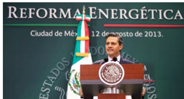
EPN Y LA RÉFORMA ENERGÉTICA

Los responsables directos de la pérdida de la nación mexicana y su entrega son un grupo de tecnócratas corruptos que asaltaron el poder mediante un fraude electoral en 1988 y dilapidaron al país en cada sexenio durante los gobiernos de Carlos Salinas, Ernesto Zedillo, Vicente Fox y Felipe Calderón. El despojo ha sido consumado con el actual “gobierno” de Enrique Peña Nieto .