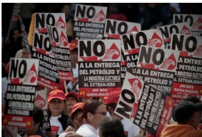
MANIFESTANTES EN CONTRA DE LA REFORMA

“El PAN en particular con su tendencia histórica irrefrenable hacia la entrega y la traición a los intereses nacionales, sólo objetó dos cosas a la reforma energética de Peña Nieto, la primera que no hubieran sido ellos los encargados de la entrega y la segunda que no se privatizara a plenitud todo el sector, es decir, para qué compartir si se puede entregar completamente”.