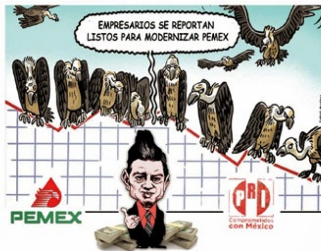
SÁTIRA DE LA PRIVATIZACIÓN DE PEMEX ILUSTRACIÓN: TABAS MARTÍNEZ

México va en sentido opuesto al sentido común al entregar sus recursos básicos y motores de su economía, esto es un reflejo más de la inmensa y generalizada corrupción que abunda en todo el gobierno mexicano, la campaña de mentiras con la que el gobierno intenta hacer tragar la píldora de la privatización quedará desenmascarada cuando la economía nacional se caiga a pedazos y no haya recursos para poder rescatar al sector, traduciéndose esto sin duda en la mayor quiebra económica de la historia de nuestro país, por ello es tan importante traer al presente el caso ENRON que no tuvo el menor escrúpulo con llevar a la quiebra a un sector de la economía norteamericana, por lo que no se puede esperar ninguna consideración con México a quienes nos consideran menos que su patio trasero. Si se permite que el gobierno priista de Peña Nieto logre ENRONchar a México con la reforma energética provocará la muerte de la economía nacional.