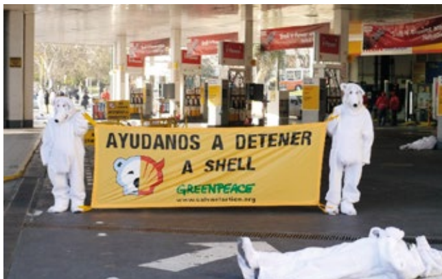
ACCIÓN CONTRA SHELL EN ESTACIONES DE SERVICIO

Así Capitanich comentó la decisión de la empresa anglo-holandesa de incrementar los precios en sus gasolineras de Argentina . Según "Infobae", en el barrio porteño de Palermo, por ejemplo, la nafta súper (gasolina) pasó de valer 9,78 pesos argentinos el litro a 10,95 . Sin embargo, no es el primer aumento por parte de Shell en lo que va del año, ya que en enero la compañía subió los precios un 7% .