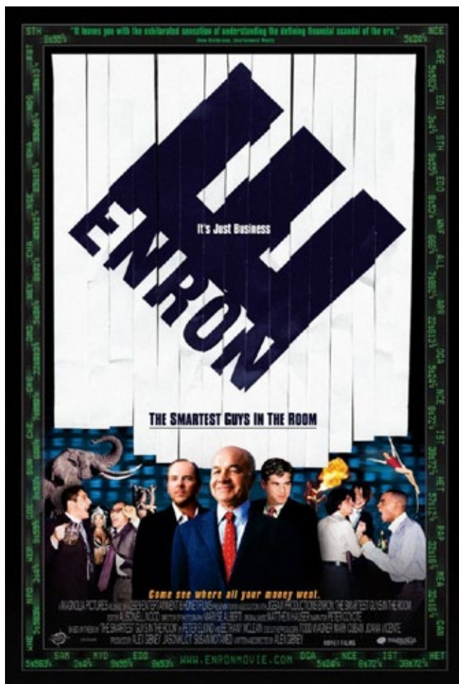
POSTER DE LA PELICULA: ENRON

ENRON además de generar toda clase de calamidades en todos los países en los que tomó el control de la generación o distribución de la energía, lo hizo también en casa, con el Estado más rico de Estados Unidos: California , y fue este caso el que logró desenmascarar toda la trama de corrupción que había detrás de la fachada de la "próspera" empresa ENRON.